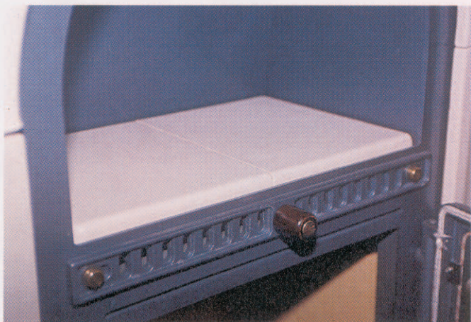
Forno scalda vivande

Di facile installazione grazie al particolare aggancio della maiolica